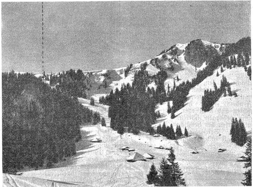
Aufstieg von den Feldmösern zur Rinderalp. An den mit + bezeichneten Stelle befand sich die Partie bei der Schneerutschung.

Die Vier fuhren am Montag morgen auf dem über Nacht frisch gefallenen Schnee nach den prächtigen Skifeldern auf Rinderalp ab. Der Aufstieg geht durch die Feldmöser und von hier über die sog. Lischböden zur ca. 350 Meter höher gelegenen Rinderalp. Die obere Lischböden stellen eine Terrasse dar, und sie tragen jeden Winter eine große Gwächte. Auf dieser Gwächte standen die Skifahrer um ca. halb 12 Uhr. Plötzlich kamen die Schneemassen in Bewegung und stürzten mit rasender Schnelligkeit in die Tiefe. Ballmer wurde durch eine Lannengruppe festgehalten, Frau Glur wurde über einen ca. 10 Meter hohen Felsabsatz hinabgeschleudert, konnte sich aber unverfehrt