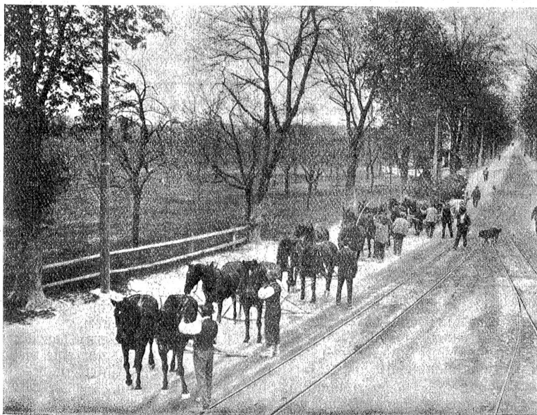
Ueberführung der Rieseneiche auf einem mit 14 Pferden bespannten Wagen nach dem Areal der Schweiz. Landesausstellung.

Handelsstatistik und Landesausstellung. Auf der handelsstatistischen Abteilung der Oberzolldirektion werden zurzeit unter der fachtechnischen Leitung von Herrn Kunstmaler Lind farbliche Tabellen angefertigt, welche in sehr anschaulicher und gefälliger Weise den Warenverkehr unseres Landes mit den fremden Staaten vergegenwärtigen. Nach Jahrgängen, Herkunfts- und Bestimmungsländern, Gattung der Waren, Mengen und Werte derselben ist hier alles übersichtlich und klar unterschieden und zu Gesicht gebracht. Alle diese Differenzierungen sind durch in Farbe und Größe entsprechend variierende rechteckförmige Felder dargestellt. Bewundernswert ist besonders die durch den obgenannten Künstler ausgedachte und angeordnete Abtönung und Zusammenstellung der verschiedenen Farben. Die fertigen Blätter sind nicht nur vom handelstechnischen Standpunkte aus sehr beachtenswert, sondern sie bieten auch