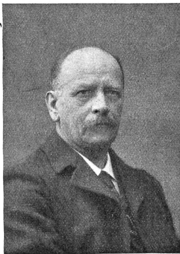
† Johann Jakob Kull.

Der Verstorbene wurde am 8. Juni 1846 in Langenthal geboren. Schon in