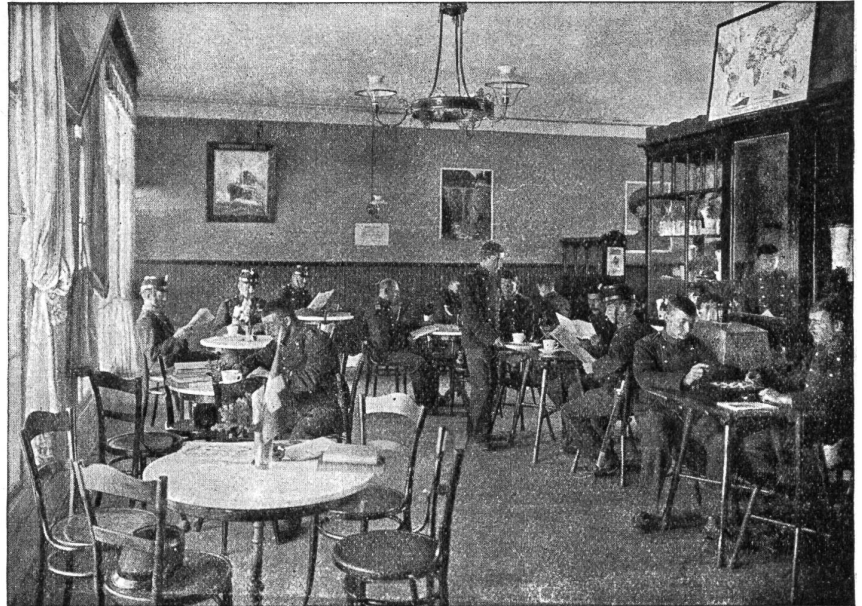
Soldatenstube Nr. 103. Eine fremden-Confiserie.

Es ist natürlich zu sagen, daß wir vom Armeestab und von den Divisionskommandanten von Anfang an sehr viel Entgegenkommen und Hilfe erhielten; diese Herren haben uns manchen Weg geebnet und manche Schwierigkeiten aus dem Wege geräumt. Wir haben allerdings lernen müssen, mit den primitivsten Mitteln auszukommen. Unsere Mittel waren anfänglich so knapp, daß wir in den ersten vier Wochen mit Schulden wirtschafteten. Aber mit einem glücklichen Idealismus hofften wir auf die so notwendigen Mittel und wirklich, unser Glaube wurde nicht zuschanden. Die innert drei Wochen eingerichteten dreißig Soldatenstuben erbrachten rasch den Beweis, daß wir die Sache praktisch angefaßt hatten und daß das Werk lebensfähig war. In vielen Ortschaften waren es wirklich die einzigen heimeligen Räumlichkeiten. Wir statteten die Soldatenstuben mit Büchern, Tageszeitungen, Zeitschriften, Spielen und Schreibmaterial aus. Seit April werden nun sämtliche Soldatenstuben mit Büchereien der Schweizerischen Soldatenbibliothek, die unter der Leitung von Herrn Hauptmann Wirz steht, ausgerüstet. Schöne Bilder, von Ge-