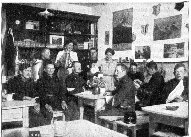
Soldatenstube Nr. 54 im Cessin.

„Als im November letzten Jahres einige Damen des Verbandes Soldatenwohl damit begannen, im Jura für die Truppen Soldatenstuben einzurichten, da hat keine von