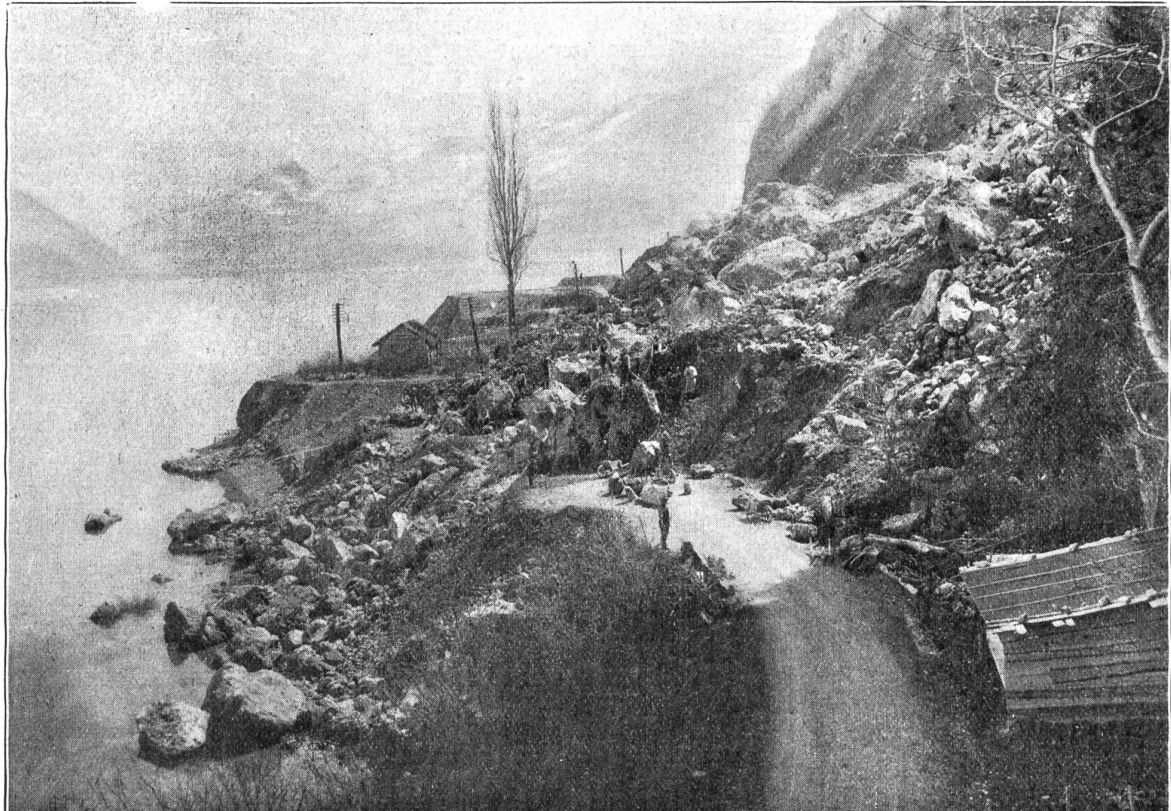
Der Bergrutsch zwischen Faulensee und Leissigen am Thunersee.

In Anbetracht der gegenwärtigen Lage hat das Armeekommando die Aufhebung folgender 14 Preßkontrollbureaux vom 1. Mai abhin verfügt: Lausanne, Neuenburg, Freiburg, Bern, Biel, Aarau, Solothurn, Luzern, Zürich, Win-