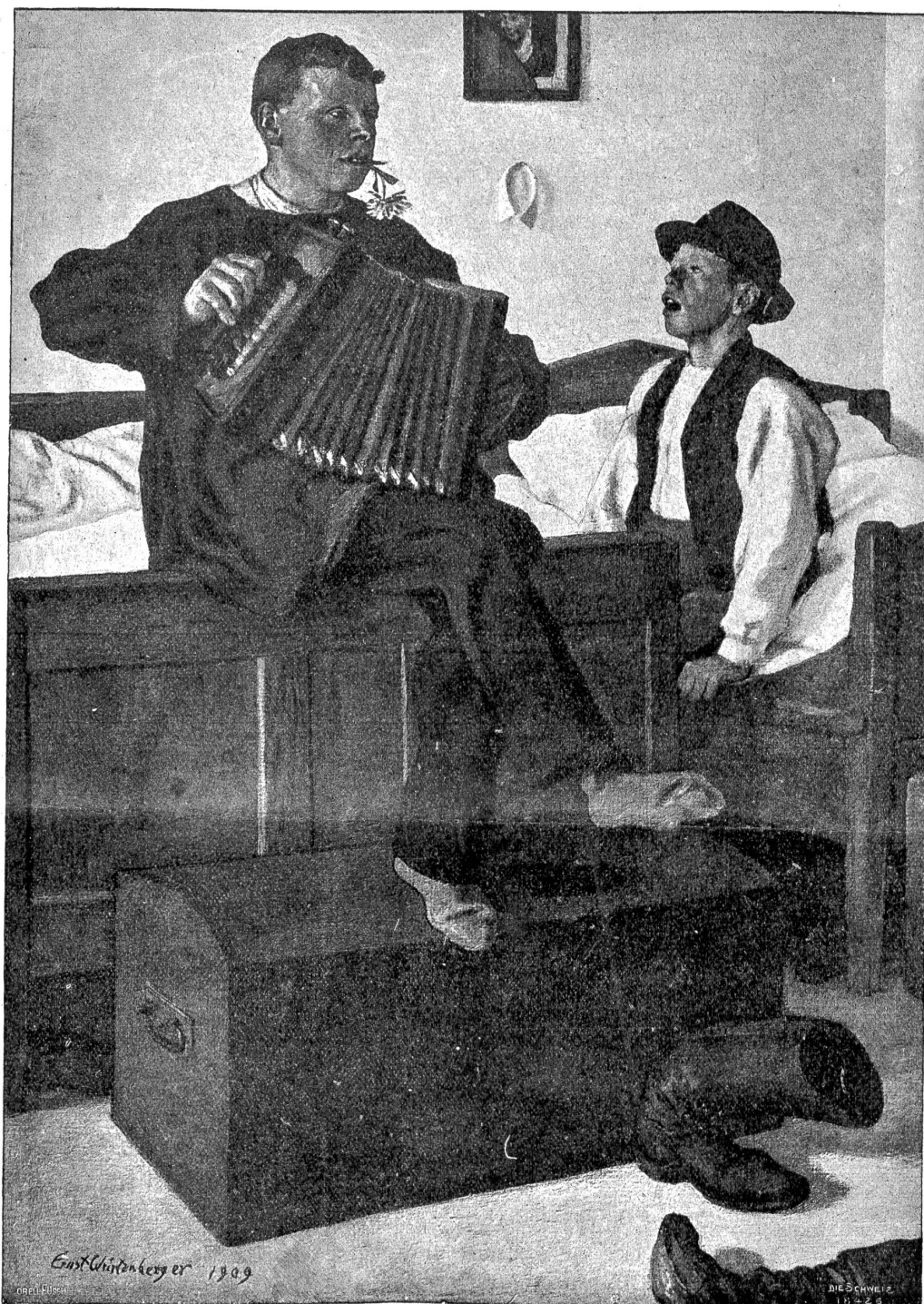
E. Württemberg: In der Knechtekammer.

„So „enorm reich“ wird sie wohl nicht sein, aber ein wunderbares Haus hat sie schon und das allein wäre