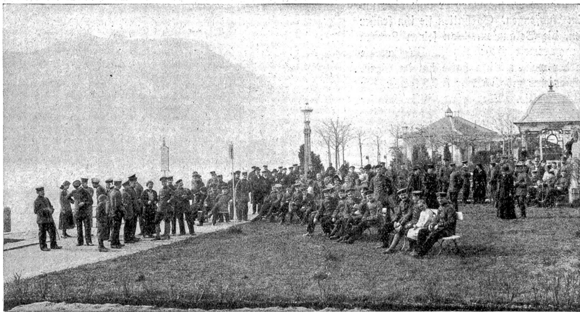
Deutsche Internierte in Weggis (Vierwaldstättersee).