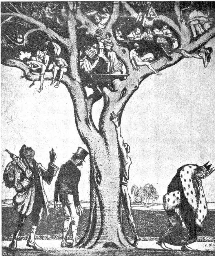
Sritz Gilsli, St. Gallen: Saure Trauben (Radierung). Schweiz. Kunstausstellung in Zürich 1917.

„Sie können, was Sie wollen“, rief Hellebede, der sich mit Mary unterhalten und doch jedes Wort gehört, das von Lis oder zu Lis gesprochen worden. (Fortsetzung folgt.)