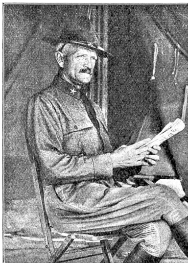
John J. Pershing,

der Front südlich Zborow eingedrückt, zahlreiches Material aus den Gräben geholt und Gegenangriffe abgeschlagen. Die Vorstöße auf Brzezany hatten anfänglich Erfolg, endeten aber mit der Vertreibung der in die Gräben gedrungeenen Russen. Gegenwärtig wütet auf denselben Fronten eine heftige Artillerieschlacht. Im Arbeiter- und Soldatenrat wurde mit \frac{2}{3} Mehr eine Glückwunschartik an die Tätigkeit der Armee beschlossen. Rußland horcht auf. Alle Reden Kerenskis stellen die Lage als höchst gefährlich dar; so die der Infanterieattache vorausgegangene Proklamation. Der Feind wird darin von neuem als der Verräter hingestellt, der Separatfriedensversuche unternahm, um dann zuerst im Westen, hernach im Osten zu siegen. Wie nun aber auch die Offensive zustande gekommen sei, aus der Not der Revolution ward sie geboren; die Befürworter des Krieges glauben an ihre Notwendigkeit ebenso sehr, wie die Friedensfreunde im Kriegsende allein die Rettung der Bewegung suchen. Und die Revolution ist in Gefahr. Vielleicht beinahe weniger bedroht von Deutschland als von England, das mit allen Mitteln den vorzeitigen Friedensschluß zu verhindern sucht, einen Separatfrieden der Revolution mit dem Gegner aber nicht ertragen kann. Schon wurden Stimmen laut, die von einer Wiederaufrichtung des Zarentums seitens Englands sprachen. Was hält die Diplomatie Sir Buchanans zurück, im