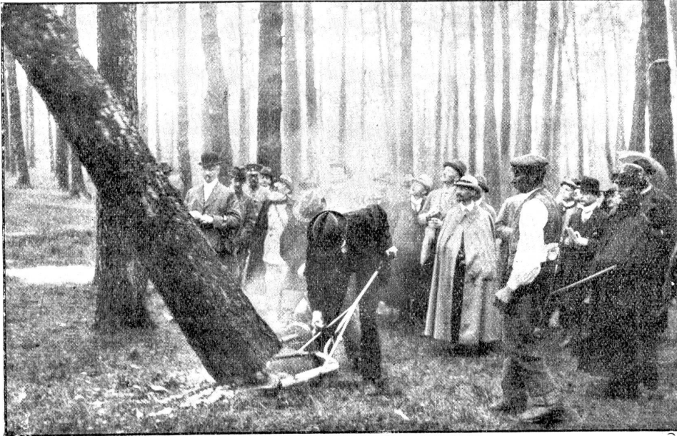
Bilder vom Kriege: Deutsche Motor-Baumfäll- und Sägemaschine.

Aufgabe es ist, den Einkauf von Brennmaterial und dessen gleichmäßige Verteilung an die Konsumenten zu besorgen. Der Leiter des neuen Amtes ist noch nicht bekannt. — Die Telephonverwaltung Bern hat die tägliche Arbeitszeit der Telephonistinnen vom 1. September hinweg von neun auf acht Stunden reduziert. Den Töchtern ist diese Reduktion wohl zu gönnen.