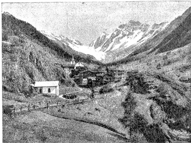
Blatten im Lötschental.

Unter dem Vorsitz von Herrn Bundespräsident Schulthess und unter zahlreichem Zugang von Mitgliedern des Nationalrates fanden jüngst in Bern Verhandlungen über die künftigen Milchpreise statt. Die Vertreter der Milchverbände verlangten eine Erhöhung des Milchpreises um 2 Rappen pro Kilo, während die Vertreter des Bundes, in Rücksicht auf die Konsumenten, von jeder Erhöhung absehen wollten. Die Produzenten behaupteten, daß es ohne Aufschlag unmöglich sei, genügend Milch zu beschaffen, da die Bauern bei dem herrschenden Fettmangel aus der Milch Butter machten, die Magermilch den Schweinen gäben und so eine weit höhere Verwertung der Milch erzielten, als wenn sie sie in den Konsum lieferten. Wenn der Bauer glaubt, der Preis sei zu niedrig und er finde bei anderer Produktionseinrichtung einen bessern Verdienst, so könne man da nichts machen und nichts erzwingen. Da der Vertreter des Bundes erklärte, er werde unter keinen Umständen zugeben, daß