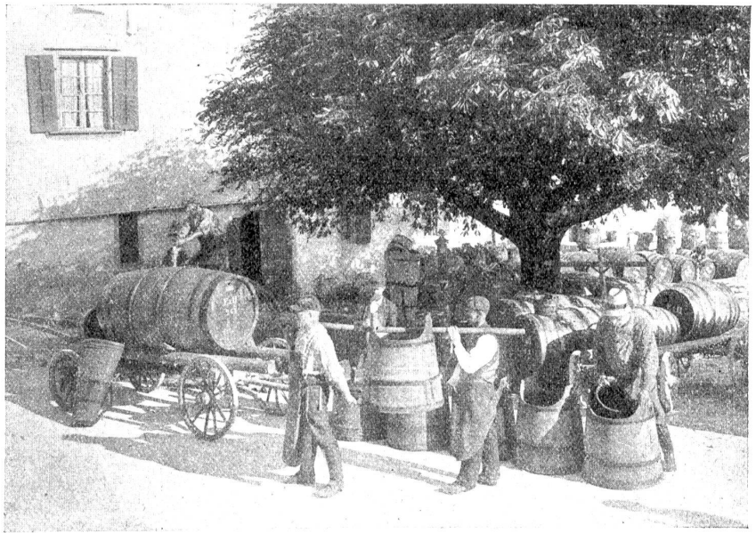
Von der Weinernte am Bielersee. Verladen des neuen Weines.

Als Hansuri gegen Abend seine zwei- und zwanzigste Bütte das Rebengäßlein hinuntertrug, fand er Margret erst unten bei seinem Wagen. Sie hatte den Fuß auf eine Radspeiche gestellt und band sich den Schuh. Als er das kleine Leiterlein hinaufkletterte, sagte sie, sie müsse jetzt gehen, die Post fahre bald und morgen müsse sie wieder im Geschäft sein. Weinade wäre Hansuri neben die Sprosse getreten. Nachdem er die Bütte ausgeleert hatte, setzte er sich auf