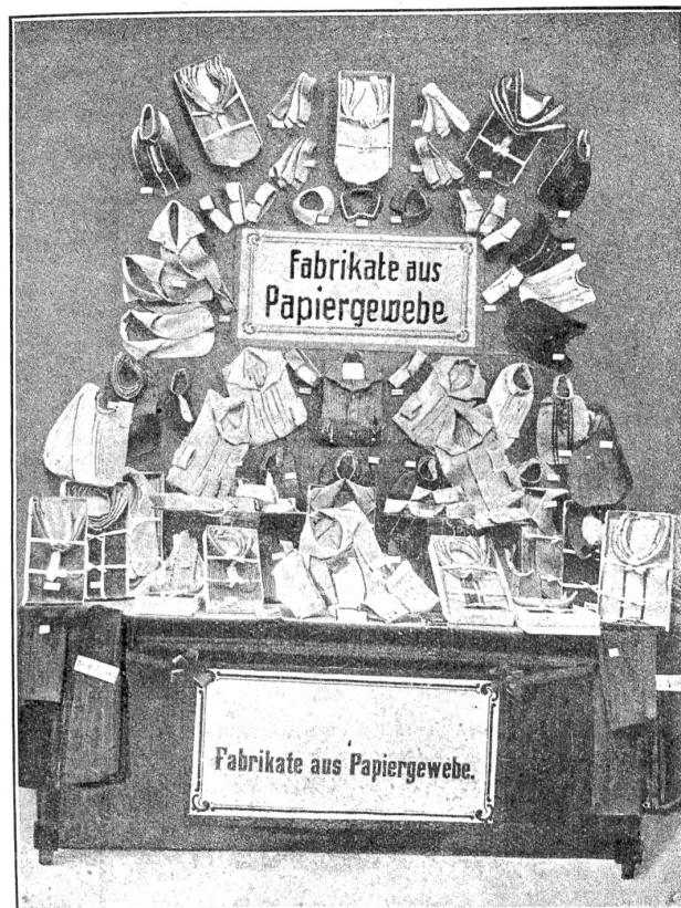
Von der Faserstoff-Ausstellung in Berlin: Herrenwäsche aus Papiergewebe.

exploitiere, su werde die Pavillons bauet, darauf zählet, süßt will ih nit Jeanette vo Muralt sy. So chömt die Lag d'r domestiques z'Vein am End noh erträglich werde.