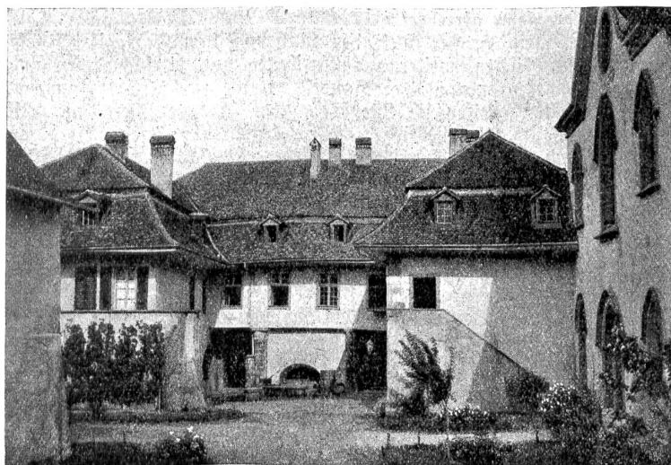
St. Johannsen: Innerer Hof vor dem Brande 1911.

Von den Grafen von Neuenburg und vom Ministerialadel der Nachbarschaft reich beschenkt, gelangte das Kloster zu ansehnlichem Besitz, über dessen Umfang die päpstlichen Bestätigungsbullen der Jahre 1185, 1197 und 1221 uns genauen Aufschluß geben. Diese päpstlichen Schreiben verzeichneten Güter und Rechte zu Erlach, Menzau,