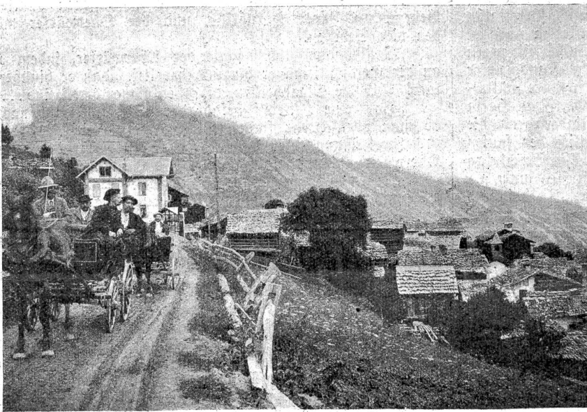
Das Dörfchen Euseigne (Ersingertal, Wallis) vor dem Brande.

Blötzlich blieb er stehen und erbleichte. Dann biß er auf die Zähne und blickte scharf und entschlossen auf eine Eiche hin. Vorsichtig schritt er näher. Das Herz klopfte ihm zum Zerpringen laut: da hinten stand einer. Vielleicht ein Häfcher. Hatte man es doch schon gemerkt, daß er fehlte? Nun, so leicht sollten sie ihn nicht fangen. Unheimlich durchbohrte sein Auge das Dunkel. Er wollte sicher sein und trat auf die Eiche zu. (Schluß folgt.)