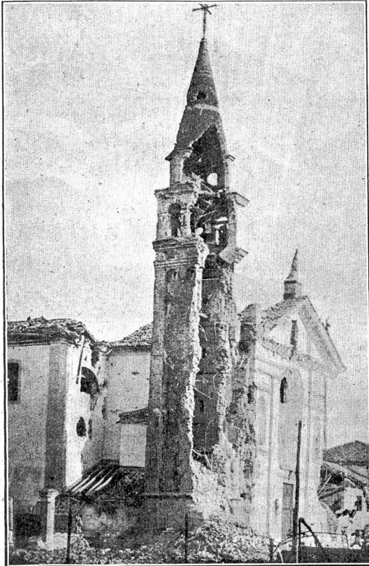
Vom italienischen Kriegsschauplatz: Der aufgeschlissene Kirchturm in Pontes di Piaves.

tretung sehe. Also: Daß es in die verkappte Annexion willkürliche Kühlmänner redet in kühleren Sätzen, die aber inhaltlich dasselbe bedeuten. Die Begründung der deutschen