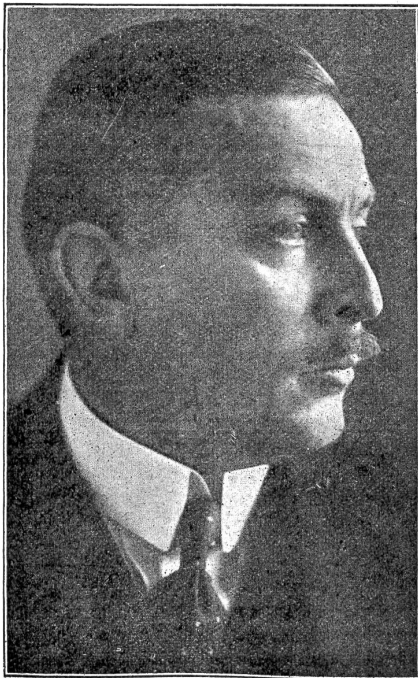
Staatssekretär des Außen von Kühlmann, Leiter der deutschen Friedensverhandlungen im Osten.

In Brest-Litowsk rangen Trojky, Czernin und Kühlmann um staatsrechtliche Grundsätze. Trojky will keinen deutsch-österreichisch-ukrainischen Vertrag gutheißen, den nicht auch die Delegation der Maximalisten von Charfow anerkennen. Er stellt sich auf den ehemals angenommenen Standpunkt, daß die Ukraine zu Rußland gehöre. Die Delegation von Kiew aber behauptet, absolut selbständig dazustehen, kraft der 4. und 5. Proklamation der Kiewer Regierung, den sogenannten „Universals“, die völlige Souveränität des Landes aussprechen. Alles kommt auf den Ausgang des Ringens in der Ukraine selber an: Eine Meldung behauptet den Fall von Charkow, eine andere Kiews Uebergang. In Südostrußland machen die Maximalisten reizende Fortschritte. Stadt um Stadt des Wolga-