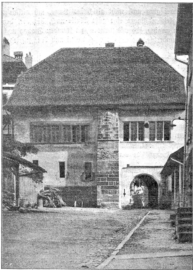
Erlach, das Rathaus, Südanischt.