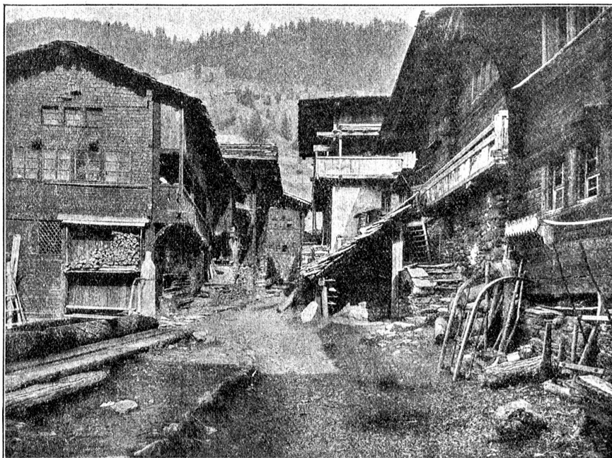
Dorfstrasse in Kippel (Lötschental).

Hernieder laßt uns dringen, Demütigen Herzens bringen Licht in der ärmsten Hütte Nacht!