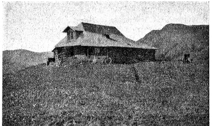
Sennhütte der Laveyalp oberhalb Lenk im Obersimmental.

Gottlob! Da ist kein pffiffiger Hüterbub. Der Senne streicht den grauen Bart und der Zusenne ladet zum Platznehmen ein; denn der hat Militärdienst gemacht und ist schon in der „Fremde“ herumgekommen. Unter dem häuslichen, am drehbaren Holzarm, dem „Turner“, hängenden „Chäs-Chessi“ lodert das Feuer. Die zum Käfen bereite Milch muß vorerwärmt werden. Flugs das Notizbuch hervor! Da gibt's viel Neues zu vernehmen. Der Senne findet es stark, Seminaristen auf die Alp zu schicken und nach dergleichen Firtlesanz zu fragen, nur einer Examenarbeit wegen. Aber die Sache muß Bedeutung haben und ein