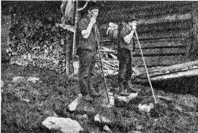
Zusammen tragen Käse und Butter in den Speicher hinab. Alp Crogen, Habbkern (Bern).

hatte sich vorgenommen, die Sprache der Sennen zu studieren. Das war gar keine so leichte Sache. Er hatte wohl gemerkt, wie der Handhub auf der Alp, die er gestern verlassen, jeweilen pffiffig, halb mitleidig und spöttisch lachte,