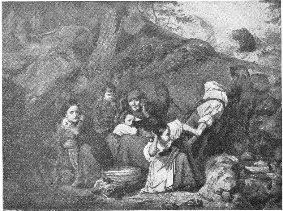
Eduard Girardet (1819—1880).

Die Zeit, in der Girardet malte, liebte das figurenreiche, erzählende Genrebild. Man wollte damals noch eine Handlung oder eine Situation dargestellt sehen, am liebsten eine, die auf das Gemüt wirkte. Solche Szenenbilder waren im Grunde nichts anderes als Illustrationen zu einer Erzählung, aus der sie den „Fruchtbaren Moment“ herausgriffen und verbildlichten. So entstanden die dramatisch bewegten Bilder „Mutterliebe“ und „Die unterbrochene Mahlzeit“ (im Neuenburger Museum). Beide lassen an dramatischer Spannung in der Situation nichts zu wünschen übrig. Der Beschauer erlebt mit der zum