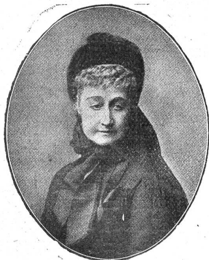
Eugenie von Montijo

Der Tod der Ex-Kaiserin weckt die Erinnerung an die Beziehungen, die Eugenie durch ihr Schloß am Untersee mit der Schweiz pflegte. Bekanntlich hat die Mutter Louis Napoleons, die Frau Gemahlin Louis Napoleons, einst König von Holland durch seines Bruders Gnade, vor den Metternichschen Verfolgungen im Kanton Thurgau Zuflucht gefunden. Königin Hortense weilte Ende 1816 und anfangs 1817 in Konstanz als Gast der Großherzogin von Baden, einer ihrer Verwandten. Doch war hier ihr Bleiben nicht, sie sollte auf Befehl der Mächte Baden verlassen. Da nahm sich die thurgauische Regierung der gehezten Königin an und bot ihr den Aufenthalt auf thurgauischem Boden an. Von der Konstanzer Familie v. Streng erstand sich dann Hortense das Landhaus Arenenberg bei Ermatingen und bezog es mit ihrem damals 10jährigen Sohne Louis. Sie verblieb hier trotz des Einspruchs der Mächte; denn die Thurgauer blieben standhaft. Das Landhaus wurde nun von Grund aus umgebaut und bekam so sein heutiges