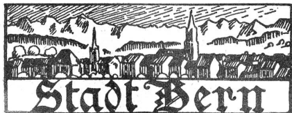
† Julius Dill,

Es wird beabsichtigt, im Jura eine landwirtschaftliche Schule zu gründen; die Vorlage dafür soll bereits in der ersten Session des Großen Rates pro 1921 behandelt werden. —