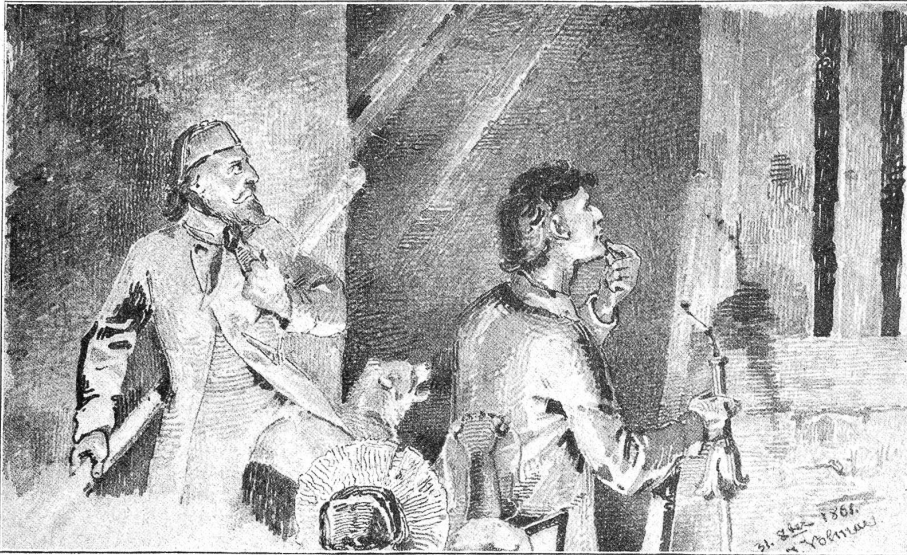
J. Volmar: Spukhaftes aus Bern-Altstadt. Das Geräusch im Frienisbergerhaus.

fehlen, so erzählen Sie uns ein wenig, wer Sie sind und woher, und was Sie da auf Reisen suchen.“