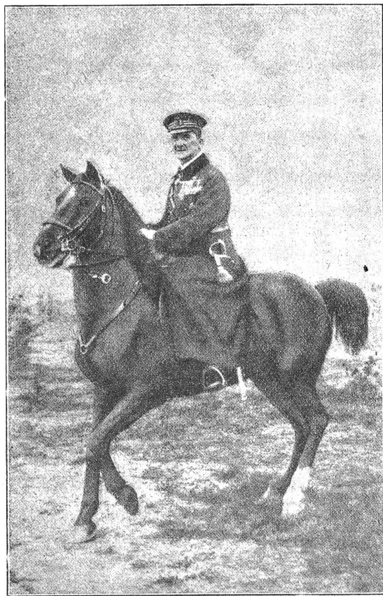
Der heutige Reichsverweser von Ungarn: Admiral Horthy.

schichte zu wenig, um die Argumente der Gegner dieser Geschichtsdarstellung, die ja ungewisselhaft bestehen — denn welche Geschichte ist restlos objektiv? — hier beifügen zu