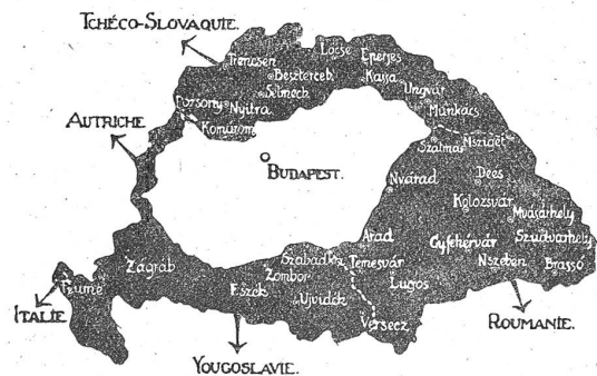
Veranschaulichung der abgetrennten ungarischen Gebiete, nach einer ungarischen Propagandakarte.

C'est la même que vous voulez imposer à la Hongrie!