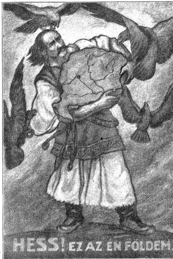
Ungarische nationalistische Propagandakarte: Die Raubvögel, die Ungarn bedrohen, bedeuten die Tschechen, Rumänen, Serben und Italiener.

schichte zu wenig, um die Argumente der Gegner dieser Geschichtsdarstellung, die ja ungewisselhaft bestehen — denn welche Geschichte ist restlos objektiv? — hier beifügen zu