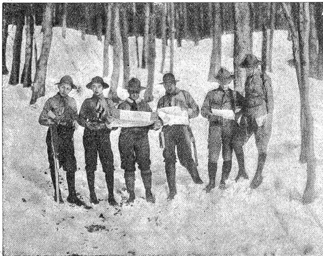
Pfadfinder beim Kartenlesen.

Man hat uns etwa unsere Uniform und die Abenteuerlichkeit des Lagerlebens zum Vorwurf gemacht. Mit Unrecht! Denn wer die Psyche des Knaben kennt, weiß, daß ein gewisses Maß von Romantik, das Bedürfnis, etwas zu „erleben“, der Bubenseele eigen ist, und daß die Befriedigung dieses Bedürfnisses in gesunden Bahnen nur von