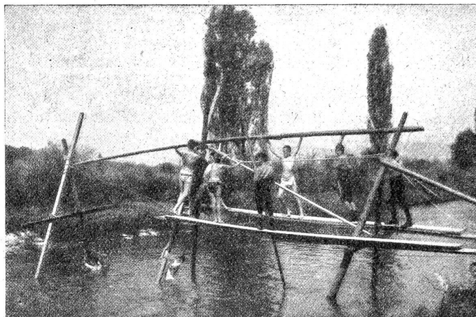
Pfadfinder beim Brückenbau.

uns fand, was er sich versprach. Und wiederum: Nicht alle Führer und Pfadfinder sind das geworden oder werden noch, was die Pfadfinderei aus ihnen hätte machen sollen: „Brauchbare, aufrechte, tüchtige Männer! Auch mit