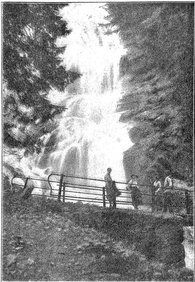
Der Dündenfall im Kiental.

ihm seine Suppe einzulöffeln. Was hätte es auch genützt? Er wäre in den Boden geschlüpft. Einer nach dem andern schlich davon, mich aber packte es von innen und ich schrie: „Der Teufel ist los, der Teufel ist los!“ So lief ich die Gasse hinunter und nach Hause.