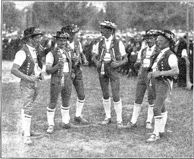
Vom Eidg. Schwing- und Aelplerfest in Bern: Jodlergruppe Urnäsch (Appenzell).

Dann begann die Zeit, in welcher sich auch die Städter um das Schwingen zu interessieren begannen. Da stiegen