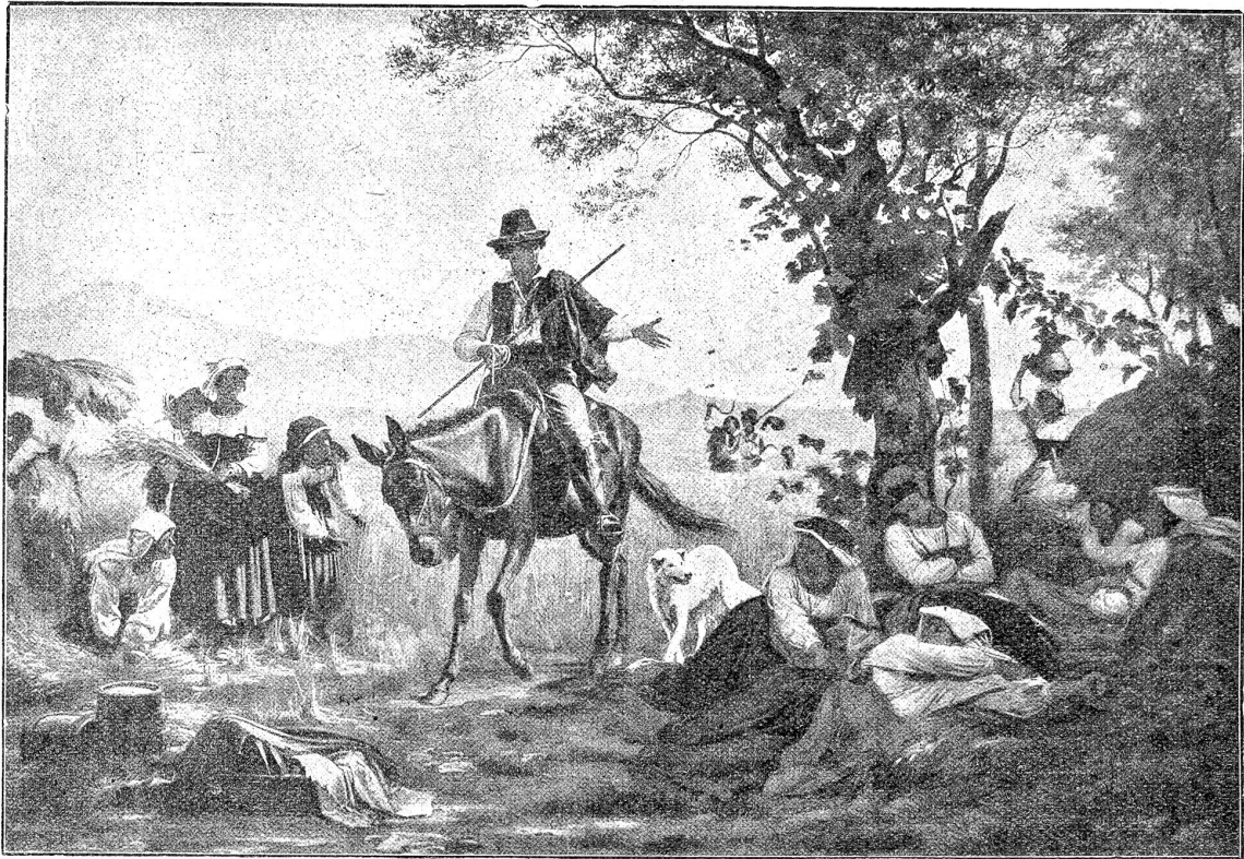
August Weckesser: Die fleissigen und die faulen Schnitterinnen.

mischer Chor studierte kurzerhand alte katholische Messstücke ein, die man der erhöhten Feierlichkeit wegen und weil niemand den Text verstehen konnte, lateinisch sang. Dieser Chor spaltete sich in verschiedene Abteilungen; Kindergruppen wurden zugezogen und eingeübt, und unter dem Namen einer den Gottesdienst neubelebenden Liturgie wurde, nur versuchsweise, ein wackeres kleines Dramolet in Szene gesetzt, aus welchem sich mit der Zeit wieder die pomphafte Darstellung eines Weltmysteriums gestalten konnte.