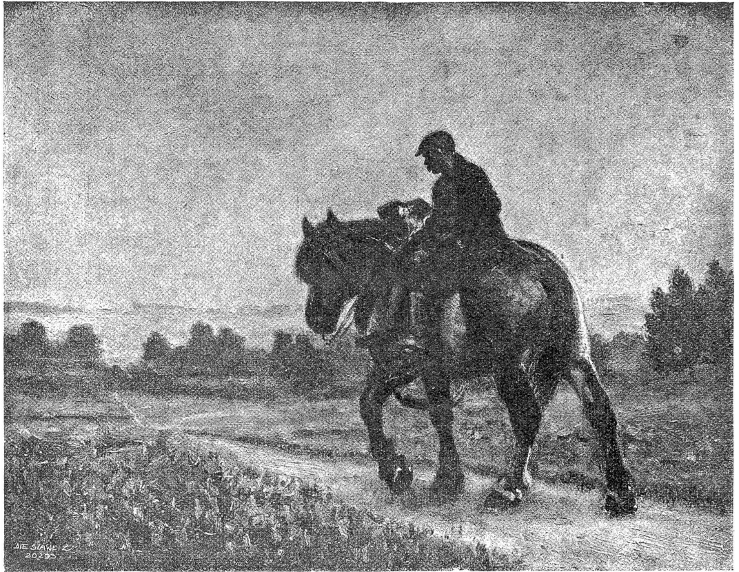
E. Ganz. — Rückkehr von der Arbeit.

Als er seinen dreißigsten Geburtstag feierte, bezog er den Tempel. Pferde, Automobile oder Dienerschaft brauchte er keine; es genügte ihm die alte Köchin und der vertraute