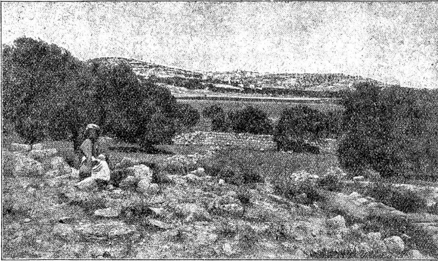
Das Feld der Hirten mit Bethlehem im Hintergrunde.

ich sinne über meine damaligen Arbeitstage und über meine jetzige Tagesarbeit, desto eifriger muß ich dir zustimmen und sagen: „Gut gesprochen! — für einen bäuerlichen Briefträger mehr als gut gesprochen!“