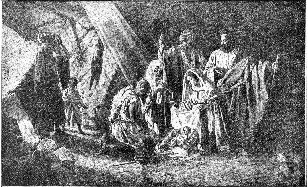
Die Geburt Christi. Nach einem Gemälde von G. Baglioli. (Das Original befindet sich in der Christus-Gedächtniskirche zu Bethlehém.)

Weil ich aber von Berufswegen nicht Holzschetter, sondern Pfarrer war, so ist natürlich meine vornehmste Pflicht nicht das Scheiten und das Sägen, sondern das Predigtstudieren gewesen. Daß es da mitunter zu einem recht sauren Sichabmühen und Ringen kam, und daß das, was dabei als Resultat abfiel, nicht so rasch wuchs wie der Schyntliberg, der neben dem Loß gleich dem Turm zu Babel in die Höhe und Breite wuchs, das werde ich später noch zu