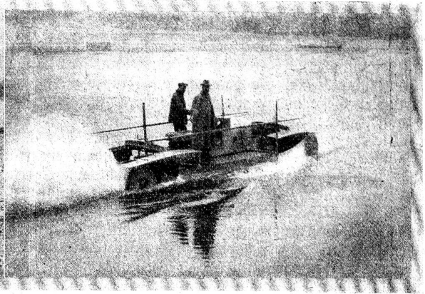
Das schwimmende Automobil von Vargoz.

Stadt Bern und in unserer aufgeklärten Zeit noch möglich sind, das berührt mein Gerechtigkeitsgefühl (oder wie man sich neuerdings ausdrückt, mein soziales Gewissen), und ich denke schon an Wohnungsrationierung und ähnliche Dinge. Doch die Frau erzählt weiter, ohne meine Gedanken zu merken. Und zwar kommt kein Klagen und kein Schimpfen, sondern eher ein Rühmen. Sie ist froh, daß sie gesund ist und jeden Tag verdienen kann für Mann und Kinder. Sie ist Abwaschfrau in einer Konditorei und kann jeden Abend ihren Kindern noch etwas zu essen heimbringen. Mit Freunden zeigt sie mir das Kesselfchen, in dem sie die Speisen heimträgt. Und über ihre Dachkammer schimpft sie nicht und neidet nicht der andern schöne Wohnungen. Denn in diese Kammer scheint Tag für Tag die Sonne, und darüber ist sie froh und glücklich. Mehr als einmal muß sie mir sagen, wie schön die Sonne hineinscheint. Nachdem sich die Türe hinter der reichen armen Frau geschlossen hat, muß ich ein Weilchen den Kopf in die Hand stützen, in mich hineinschauen und mich fragen: Hat nicht die Frau in ihrem Innern die wahre Sonne, die man allen Menschen wünschen möchte. Und ich fühle in mir den Wunsch, diese Sonne auch zu besitzen.