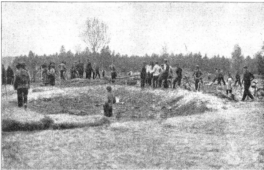
Zum Explosionsunglück in Thun. Der Trichter, wo früher das Munitionsmagazin stand.

Dies, obwohl das Projekt dem Bundesrat nur in Krisenzeiten jenes Ausnahmestandes geben will. Mit der Krisenzeit und ihren Ausnahmeverfügungen hängt auch eine andere Verhandlung zusammen: In Gunten haben die Vertreter der eidgenössischen Zollkommissionen die Verlängerung der Einfuhrbeschränkungen bis zum 31. Dezember 1923 diskutiert. Der Parteitag der Jungfreisinnigen, der am Tage vorher in Marau gefagt hatte, nannte das gegenwärtige System der Sperre sehr unvollkommen, ja schädlich, indem es der