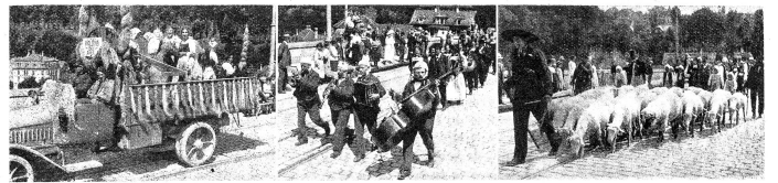
Aus dem „Vändütsch"-Besamung in Bern. — Links: Hant- und Stadswagen; Mitte: Bauernbockzeit; rechts: Schafteild.

zu großartig. Die Strecke Felsenau-Bierensee ist von Herrn Dr. Käfiger nicht weiter studiert und nicht erklärt worden, daß wohl keine besondere Hindernisse im Wege liegen. Aus allen Bevölkerungsgruppen sollte dem Projekt ein reges Interesse und tatkräftige Hilfe erweisen, damit es sich langsam entwickelt. Die Behörden müssen ihr Augenmerk stets darauf richten und zu verhindern suchen, daß durch ungewollte Neuerungen der Schiffahrt der Weg erschwert wird.