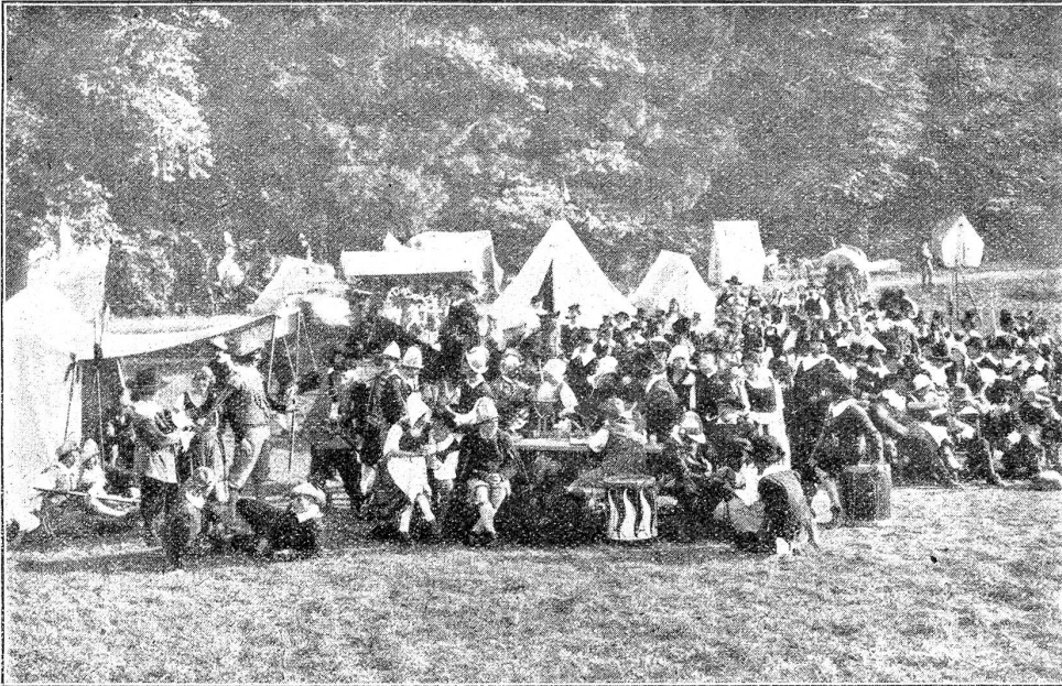
Freilichtaufführung von „Wallensteins Lager“ in Burgdorf. Lagerzener: links das Werberzelt, in der Mitte Crödlerstand und Märkelendenzelt.

leben, das alles schafft Bilder von ausgesuchter Schönheit. Unmöglich kann man all die verschiedenen Szenen in sich aufnehmen. Wohin man blickt, sieht man neue spannende Momente.