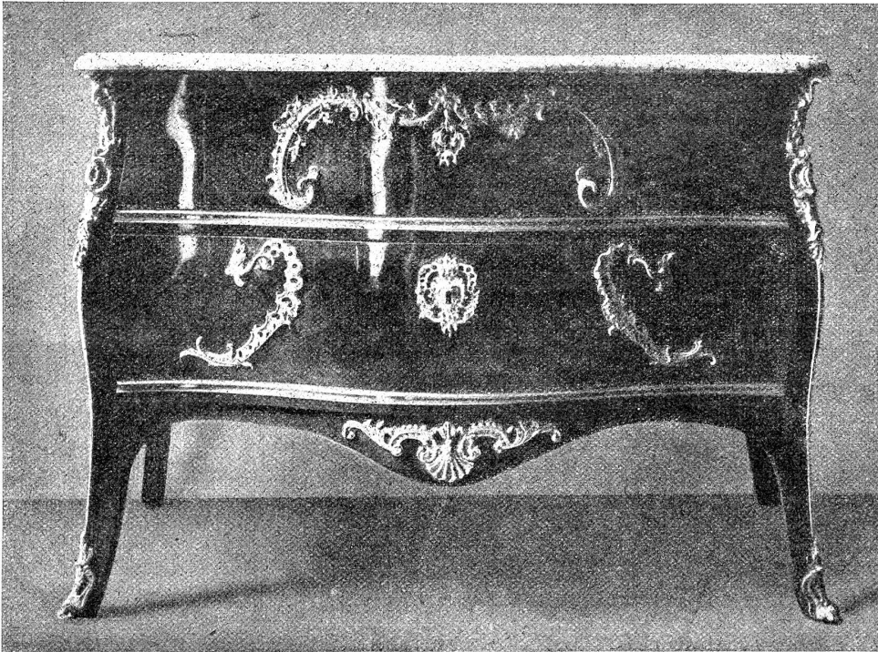
Bern. Zunft zu Mittellöwen.

Sog. Sunk-Kommode mit Platte aus Grindelwaldner Marmor. Mitte 18. Jahrhundert. (Druckstock aus „Die alte Schweiz“)