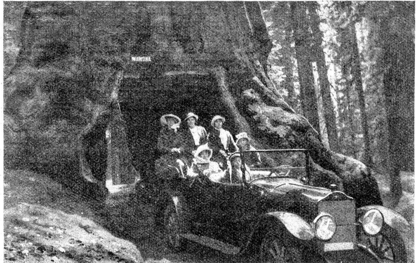
„Wowona“, die Sequoia Riesentanne in der kalifornischen Schweiz, durch die man per Auto durchfahren kann.