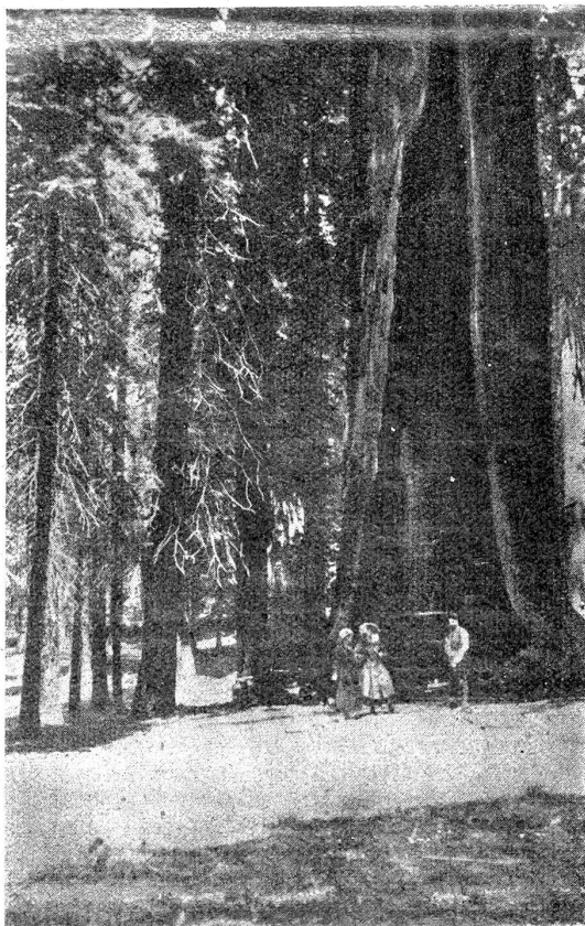
„Das Teleskop“, eine Riesentanne in der kalifornischen Schweiz, die weiterlebt, trotzdem sie vor vielen hundert Jahren bei einem Waldbrand vom Feuer ausgehöhlt wurde.

Wieder nach Kansas zurückgekehrt, fährt sie nach St. Louis, der handels- und industriereichen Mississippistadt; hier findet sie die größte Kirche der Welt, die katholische Kathedrale, deren Bau bis heute 17 Millionen verschlungen hat. Durch die Zucker- und Tabakländer des Südostens reist sie nach dem meerumspülten Florida, wo sie den milden Südwinter verbringt und dabei Land und Leute studiert. Und nun berührt sie auf der Rückreise nach Kansas und auf der Heimreise im Jahre 1918 noch Duzende von Städten des Ostens, die wir hier nicht aufzählen wollen.