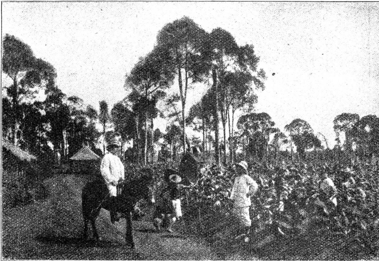
Schneiden des reifen Tabakes (Cualangs).

und um Verzeigung bitten konnte! Als ob ich selber auch nur gewußt hätte, warum ich diese unseligen Feigen stahl! Hatte ich das denn gewollt, hatte ich es denn mit Ueberlegung und Wissen und aus Gründen getan?! Tat es mir denn nicht leid? Litt ich denn nicht mehr darunter als er?