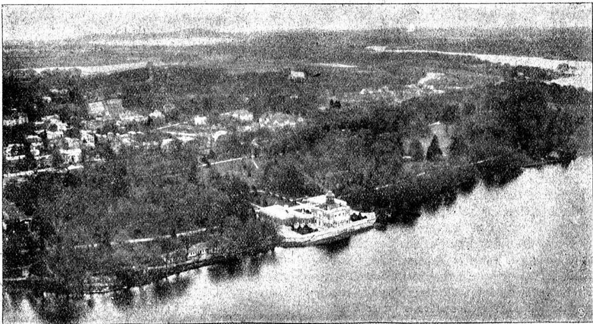
Das Marmorpalais am Havelsee.