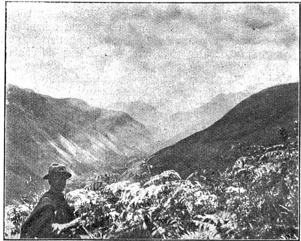
In den Ostcordilleren.

Fahrt dank den phantasievollen Erzählungen unseres Peons gebührendes Aufsehen erregt.