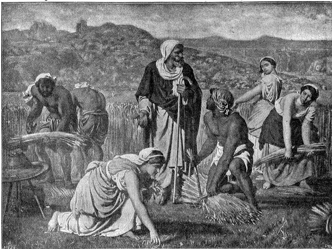
Karl Gleyre: „Ruth und Boas“. Aus dem Zürcher Neujahrsblatt der Künstlergesellschaft 1879.

Das Schiff lief in Toronto zu einer Abendstunde ein, die der jungen Miß allenfalls noch gestattete, vor völliger Dunkelheit ihr väterliches Haus zu erreichen; aber sie mußte sich beeilen. Hier bewies sich nun Staunton als ein ihrem Dienste sich weihender Kavalier, dessen Beistand das, wie schon gesagt, mit Handgepäck allzureichlich belastete Mädchen gern annahm. Aber Stauntons freundliche Sorgfalt erstreckte sich nicht bloß auf die Hilfe beim Aussteigen aus dem Dampfer, sondern er wollte auch für die Miß einen kleinen Wagen mieten, der sie zu ihrer Behausung führen sollte. Da lachte das Mädchen fröhlich und erklärte ihrem Beschützer, ein Wagen, und wäre es das leichteste Kabriolet, könne an einer gewissen Stelle des Waldes nicht durchkommen, da eine eigentliche Straße, ja auch nur ein breiter Fußweg nach der einsamen Ansiedlung noch nicht besteshe. Aber reiten werde man doch können? fragte Staunton. Und als Grace dies bejahte, bat Staunton die junge Waldnymph, die an der Höflichkeit ihres Kavaliers immer größeren Gefallen fand, hier einen Augenblick seiner zu harren;