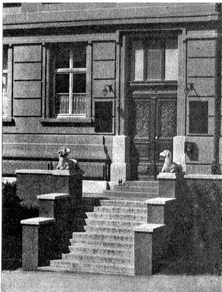
Eingang für Patienten.

Im Jahre 1482 gab es laut Urkunde 4 Hebammen in der Stadt Bern; gleichzeitig war in der sogenannten „Glendherberge“ eine Wehmutter angestellt für besondere Fälle. Hier wird man den Anfang der bernischen Frauenklinik und Entbindungsanstalt zu suchen haben. In späterer Zeit entstanden Notfallstuben im Bürgerspital und im Insel-