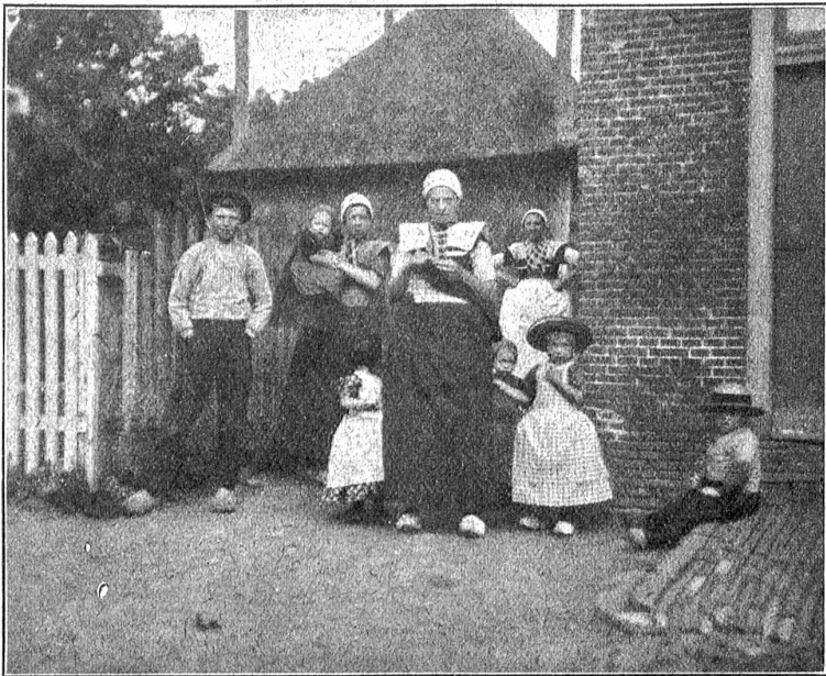
Volksgruppe aus einem holländischen Dorfe.