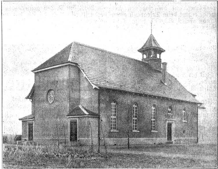
Gemeindehaus in Strättligen bei Thun.

Bei den Bundesbahnen beträgt der heutige Verkehr nach Zugszahl gerechnet rund 70 Prozent des Verkehrs im Jahre 1913. Der Güterverkehr ist annähernd gleich stark wie unmittelbar vor dem Krieg, während die Personenbeförderung noch etwas geringer ist. Der Kohlenverbrauch belief sich im Jahre 1913 auf 720,000 Tonnen Kohlen; der heutige Verbrauch stellt sich auf zirka 450,000 Tonnen, wobei die Gotthardbahn schon als elektrifiziert betrachtet wird. Durch die bisherigen Elektrifikationen werden bereits 150,000 Tonnen Kohlen erspart. — Gegenwärtig