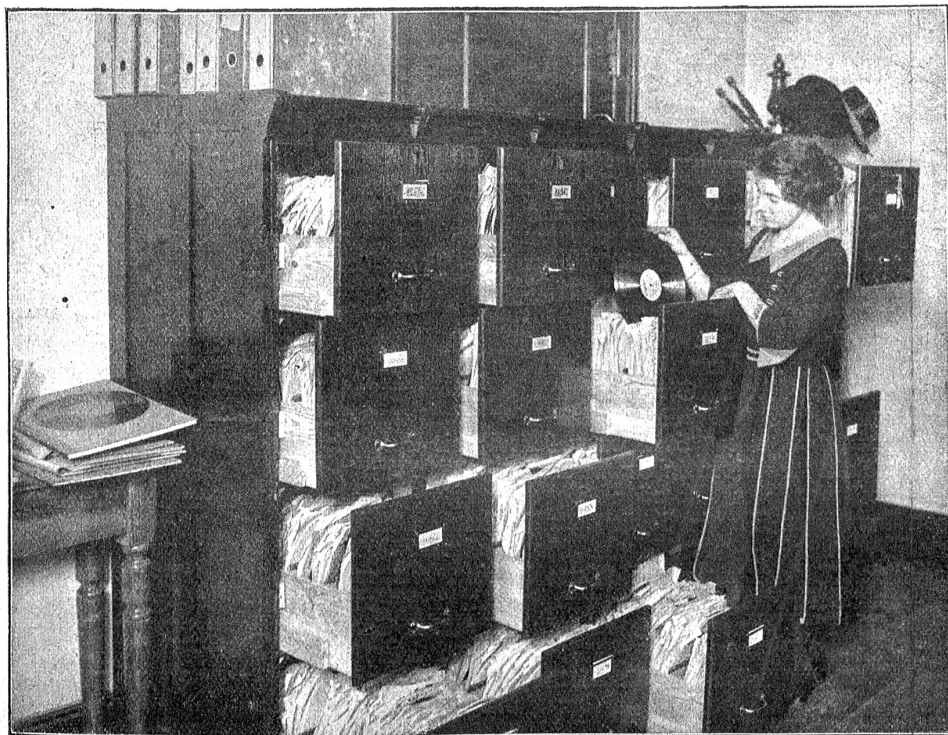
Ein Teil des Stimmenseums an der Preussischen Staatsbibliothek. Die Lautplatten haben nach dem Gutachten erster Chemiker eine Lebensdauer von etwa 10,000 Jahren.

Es ist nicht ohne Reiz, sich auszudenken, wie ein fernes Geschlecht das Bild unserer gegenwärtigen Kultur wird überliefert erhalten. Nehmen wir an — diese Möglichkeit ist ja leider durch die Entwicklung der letzten Jahre in konkrete Nähe gerückt — Europa und damit vielleicht die ganze zivilisierte Welt werde durch ein Kriegs- und Seuchenjahrhundert verheert und junge Barbarenvölker richten einst auf den Trümmern der alten eine neue Kultur auf. Welche Schätze von Hilfsmitteln würden da der Ruinenschutt der Weltstädte, der Grund der Aecker und Weinberge, der Schlamm der Meere und Seen den Archäologen jener entlegenen Kultur bieten zur Rekonstruktion der Vergangenheit! Denken wir uns nur aus, was wir von den alten Babyloniern alles wissen könnten, wenn wir aus dem mesopotamischen Wüstensande nicht nur Tontafelbibliotheken, sondern ganze Bildergalerien und Kupferstichsammlungen, in staub- und feuchtheitsicheren Safes eingeschlossen, herausgraben könnten!