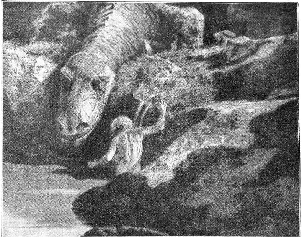
Siegfried badet sich im Blut des erschlagenen Lindwurms.

Die Uganda - und Aschanti -Neger opferten bis