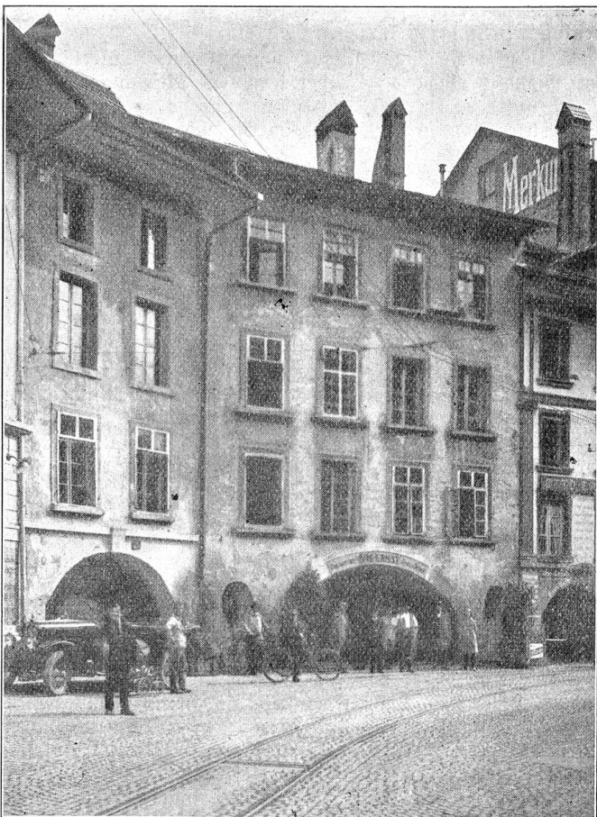
Der Scharnachtalhof in Thun. — Vor dem Abbruch.