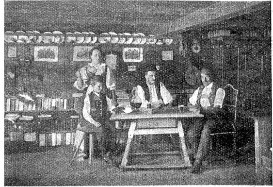
In der Ahnenstube (Coggenburg).

lichen Sohlen durch das Haus huscht und niederkauert in jedem Winkel der freundlichen Wohnung. Meta wird immer wirrer und angstvoller zumute. Wenn ihr nur wer