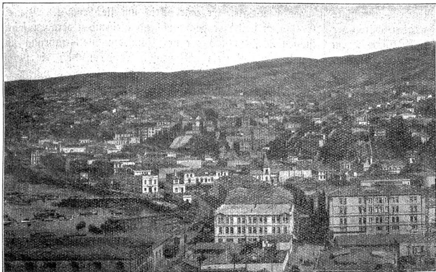
Valparaiso, die grösste Hafenstadt Chiles.

ahnen, daß Bernhard möglicherweise eine Entschuldigung hatte, wenn er sie kalt nannte und ihr vorwarf, sie wisse nicht, was liebhaben heiße.