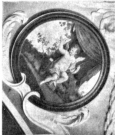
Schloss Reichenbach. — Deckendetail.

Die „Post-Fischer“ sind zweifellos durch das Postregal reich geworden. Denn der Pachtzins blieb über hundert Jahre lang der gleiche, während der Verkehr sich gewaltig entwickelte und dem entsprechend die Einnahmen wuchsen. Erst 1793 wurde die Pachtsumme erhöht und zwar auf