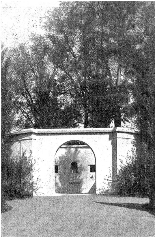
Friedhofsausstellung Bern, Juni—September 1925 (Bremgartenfriedhof). Kolumbarium.