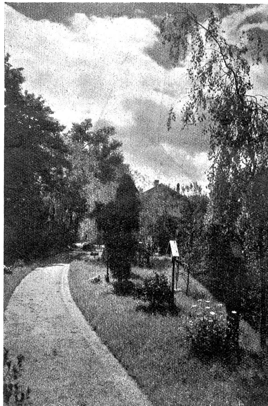
Sriedhofsausstellung Bern, Juni—September 1925 (Bremgartenfriedhof). Ländlicher Sriedhof.

an Klärchen. Da der Nachmittag am Sinken war und es kühl wurde, waren ihre Finger steif und ungeschickt. Aber